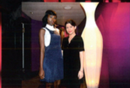
Un look du label TOUJOURS TOI - FAMILY AFFAIRS, créé à New York par l'Anglo-Zurichoise Nina Egli. La mélancolie des brumes écossaises et l'excitation ludique de la métropole américaine réunies en une collection élégante, fun et charmeuse.