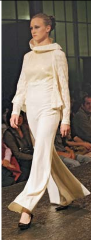
iNKL.: Tragbare Haute Couture aus Liestal