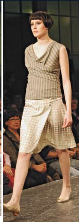
S#F Fashion: Schlichte und elegante Kreationen